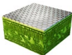
Technologie co-cristal sur feuilles