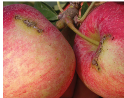
Dégâts de tordeuse de la pelure